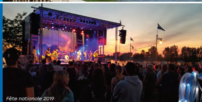
Fête nationale 2019