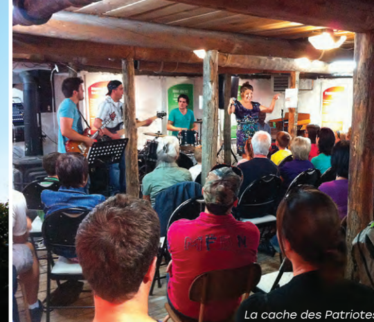
La cache des Patriotes