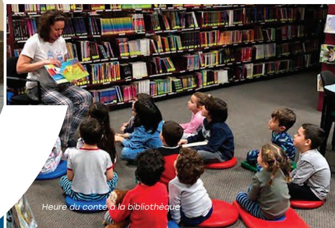
Heure du conte à la bibliothèque