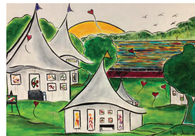
Œuvre de Lyse Jussaume