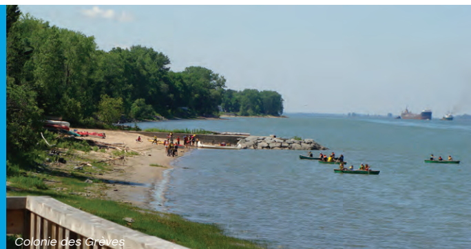
Colonie des Grèves