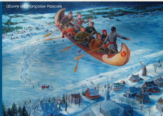
Œuvre de Françoise Pascals