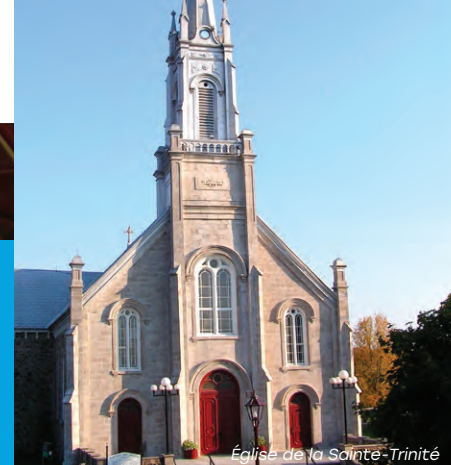
Église de la Sainte-Trinité