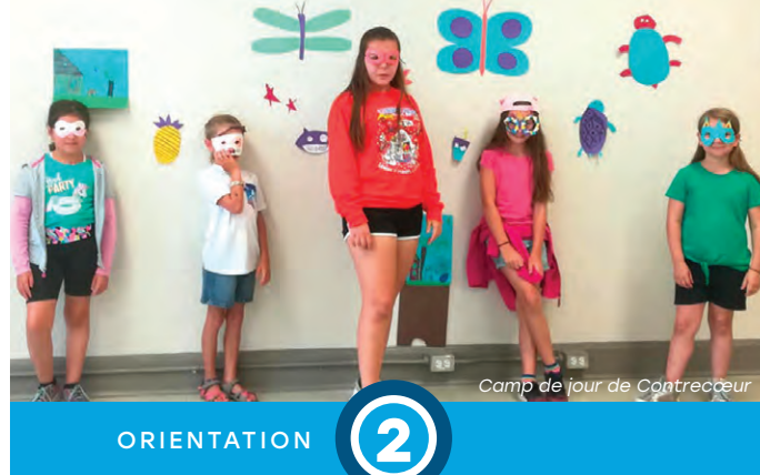
Camp de jour de Contrecoeur