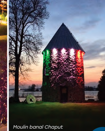
Moulin banal Chaput